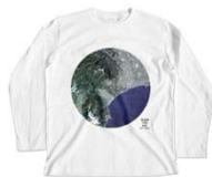
ロングスリーブTシャツ