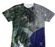
Tシャツ(全面・片面)

「WEAR YOU ARE」は、今いる場所や、ご自身のお気に入りの場所の衛星写真を自由にカスタマイズし、全面プリントTシャツやスマートフォンケースを作成・購入できるファッションブランドです。新たに「Tシャツ」「ロングスリーブTシャツ」「スウェット」「ベイビーロンパース」「ウォレットフォンケース」のラインナップが追加されました。