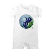
ベイビーロンパース